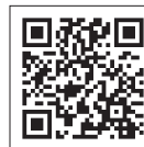
コンクール 特設ホームページ